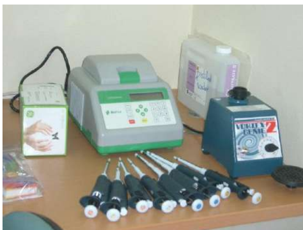
左) 感染症診断機PCR機材他

ヘルスサイエンス大学構内と、ヘルスサイエンス大学附属病院セタティラート病院内に感染症予防センターの設立を開始した。開始時には何もない状態であったので、まずは、この2つの施設でのセンター設立を試み、地方核病院へ広げていく予定である。8-1.、8-2. で述べたように、多くの資機材、消耗品が外務省NGO連携無償資金協力の支援金で投入され、本法人の資金、専門家の寄付、ヘルスサイエンス大学自らの資金も加わり、設備は充実してきたといえる。主に、ヘルスサイエンス大学では、実習室、講義室を整備、セタティラート病院では PCR とその付属品、試薬、消耗品を新しく設置した臨床検査室に整備した。