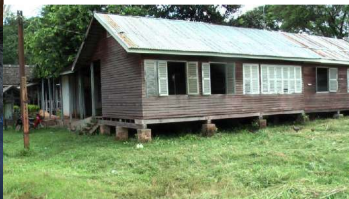
(下): Bolikhamsai 県 Pakkading 地区病院